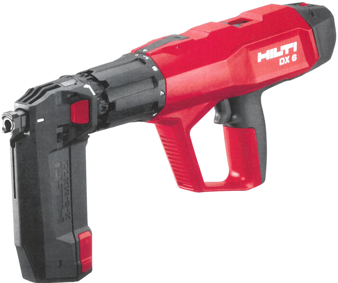
Abb.: Bolzenschubgerät DX 6 im Kaliber 6,8/11 M